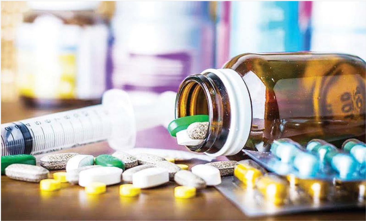
تپ مالت (بروسلوز) مبتلا شده‌ام. «وی با اشاره به پروسه درمان بیماری‌اش تصریح می‌کند: «درمانم نیز تعریف چندانی نداشته و به خاطر مصرف دوز اشتباه دارو، عفونت به قلمم زده و دچار میکوآر دیت شدم. البته داروهای تب مالت پیمیدگی چندانی ندارند و معمولاً برای درمان تب مالت از ریفامپین و داکسی‌سایکلین خوراکی استفاده می‌شود. البته گاهی هم استرویتوما سین نیز برای درمان این زن جوان که مترجم زبان انگلیسی است، ادامه