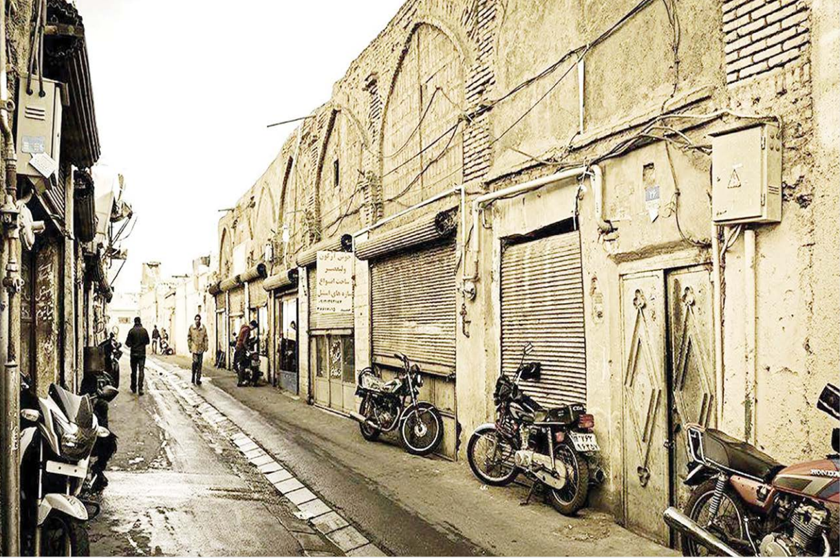
یک خیابان در شهر مشهد