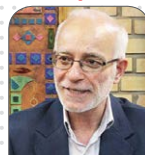
حسن بهشتی پور