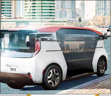
تاکسی اتوماتیک در دبی

اداره راه و ترابری دبی و کروز توافق نامهای را با این شرکت آمریکایی امضا کردند تا تاکسی‌های مستقل در این شهر با تکنولوژی بالا کار کند. در بیانیه اعلام شده که ۴ هزار خودرو خریداری می‌شوند. براساس تصمیم گرفته شده تعداد کمی از این خودروها در سال ۲۰۲۳ در دبی آغاز به کار می‌کنند، هرچند مشخص نیست که چه زمانی آنها اقدام به سوار کردن مسافر خواهند گرفت. این تاکسی‌ها