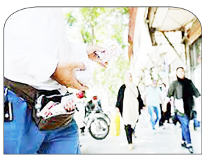
مطالبات صنعت دارو از دولت سیزدهم