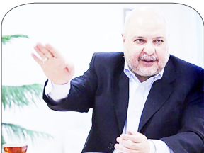
رئیس کمیته اقتصادی کمیسیون

برنامه و بودجه مجلس مطرح کرد در خوش بینانه ترین حالت ۶۰ درصد بودجه محقق می‌شود