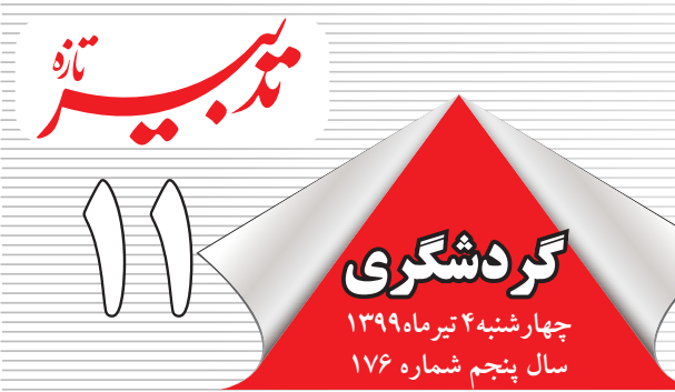
هفته نامه اقتصادی-اجتماعی

این ملک و جزیره، یک شاهد کم نظیر از شواهد و نشانه‌هایی در طول دوران پیوسته تاریخی است و بسیار عالی برای باستان شناسان، تاریخدانان و جامعه شناسان روند شکل گیری و رشد بی این و چهارچوب‌های آن را نشان می‌دهد. به همین دلیل این جزیره برای چنین افرادی بسیار اهمیت