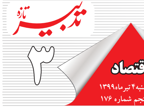
هفته نامه اقتصادی – اجتماعی

رییس اتاق ایران و چین گفت: مبادلات هر بازار غیرقانونی هم در سیستم بانکی جابه‌جا می‌شود بنابراین هرچه گردش‌های مالی ریالی شفاف‌تر شود کلیه تخلفات قابل کنترل‌تر می‌شود؛ همتی جای درست را برای کنترل این بازار نشانه گرفت که آن‌هم بازار مبادلات ریالی بود بنابراین همچنان تقاضای بازار ارزی خیابانی تقاضای مؤثر اما ضعیف شده است.