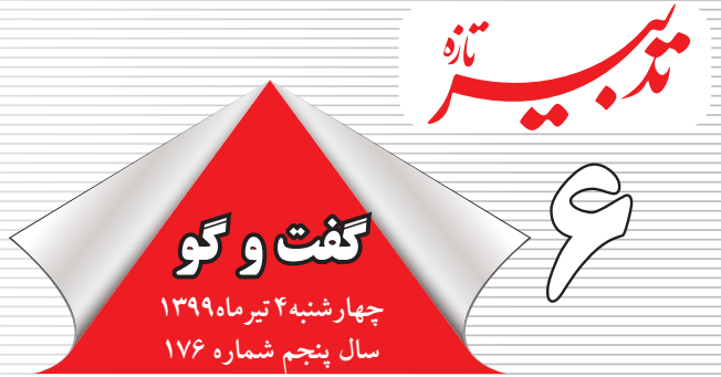
هفته‌نامه اقتصادی اجتماعی