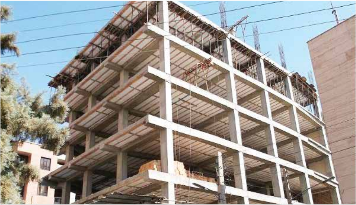
ساختمان در حال ساخت در تهران

دوش مستاجران می‌شود و کمکی به آنها نمی‌کند. در این بین سیاست‌های حمایتی و نظارتی دولت نیز راه‌حلی برای مشکلات بازار مسکن نیست. برای مثال دگرگونی‌هایی که چندی پیش در ساختار کد رهگیری از سوی صنف اتحادیه حاکم شد، منجر به بالاتکلیفی این صنف شد. همچنین نداشتن اشراف و تجربه وزارت راه و شهرسازی برای راهبری صنعت و بازار مسکن باعث شده است این مجموعه خوب پیش نرود و بالاتکلیفی برای مستاجران، خریداران و معامله‌ان مسکن در جامعه پیش بیاید.