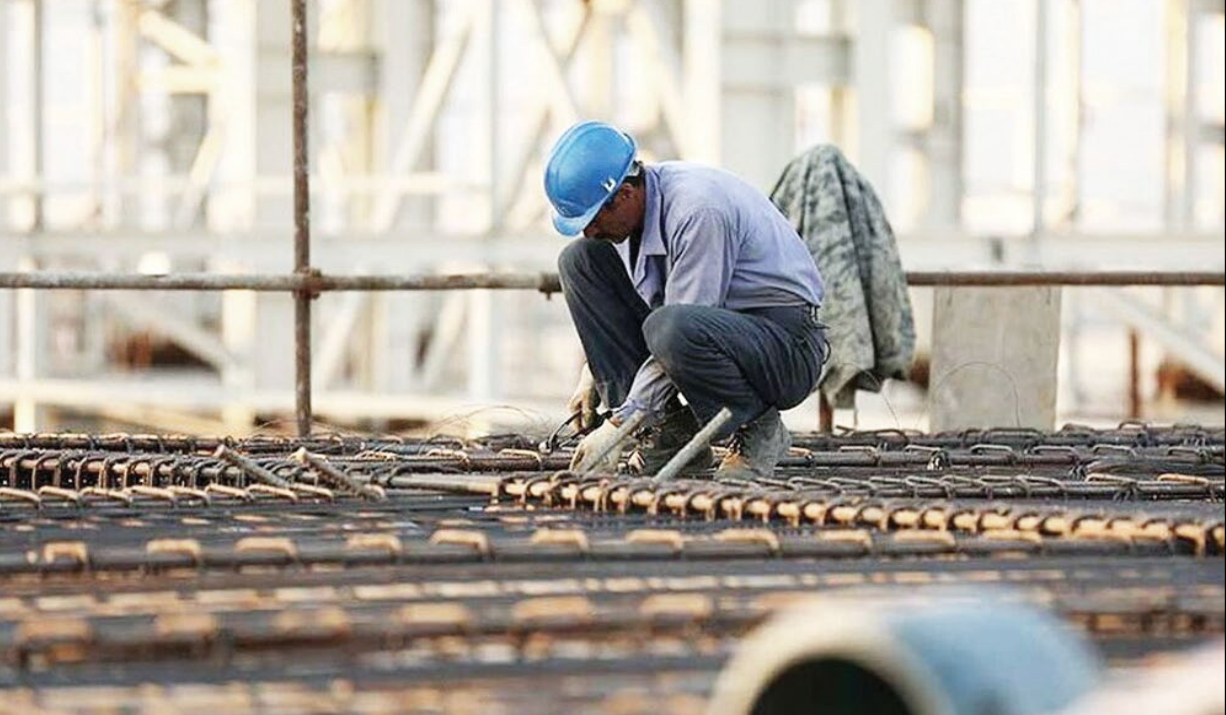
نماینده کارگران در شورای عالی کار در جریان جلسه کمیته مزد

نمایندگان کارگران در شورای عالی کار در جریان جلسه کمیته مزد