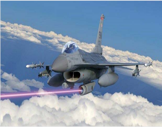
یک هواپیمای جنگنده با یک لیزر قدرتمند در حال هدف قرار دادن یک هدف در آسمان.

لاکهید مارتین در مرحله دوم مأموریت ساخت ابتکار مقیاس لیزری پر انرژی قصد دارد خروجی مربوط به سلاح لیزری خود را تا قدرت