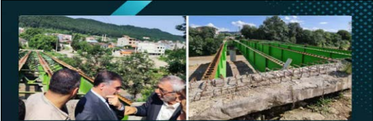
همزمان با دوازدهمین سفر شهرستانی استاندار مازندران به سوادکوه شمالی: