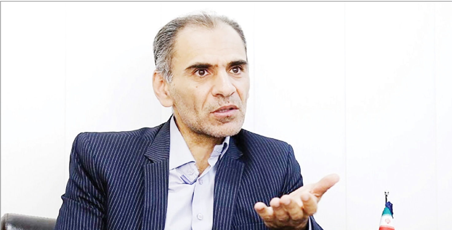
عضو هیئت علمی دانشگاه امام صادق (ع):