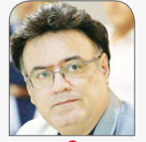
آلبرت بیخریان اقتصاددان