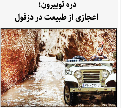
دره توپیرون؛ اعجازی از طبیعت در دزفول

خوزستان یکی از استان‌های زیبای ایران است که به واسطه زیبایی‌هایش گردشگران را حیرت‌زده کرده است. یکی از زیبایی‌های وصف‌نشدنی این استان دره توپیرون می‌باشد که در دزفول واقع شده است. به شهر دزفول می‌رویم و ۲۰ کیلومتر به سمت شرق می‌رانیم تا به دره‌ای اعجاب‌انگیز برسیم. دره‌ای که به خاطر فضای خنک و مطبوع داخلش به دره توپیرون مشهور شده است؛ یعنی جایی که تب را می‌برد و بدن را خنک می‌کند. وقتی پایتان را داخل دره بگذارید با راهرویی طولانی مواجه می‌شوید که مسیرش را با پیچ و تاب سنگ‌های دره به پایان می‌رساند. دیواره صخره‌ها مملو از آب چکان‌ها و گیاهان وحشی است که با تلاش فراوان سر از دل سنگ‌های سخت در آورده‌اند و گاهی ارتفاعشان به ۱۰۰ متر هم می‌رسد. به نظر می‌رسد که جنس مواد تشکیل دهنده بخش‌های مختلف دره ماسه‌سنگ‌ها یا همان کنگلومراهایی (۱) باشد که بر اثر فرسایش آبی در مدت طولانی تشکیل می‌شوند.