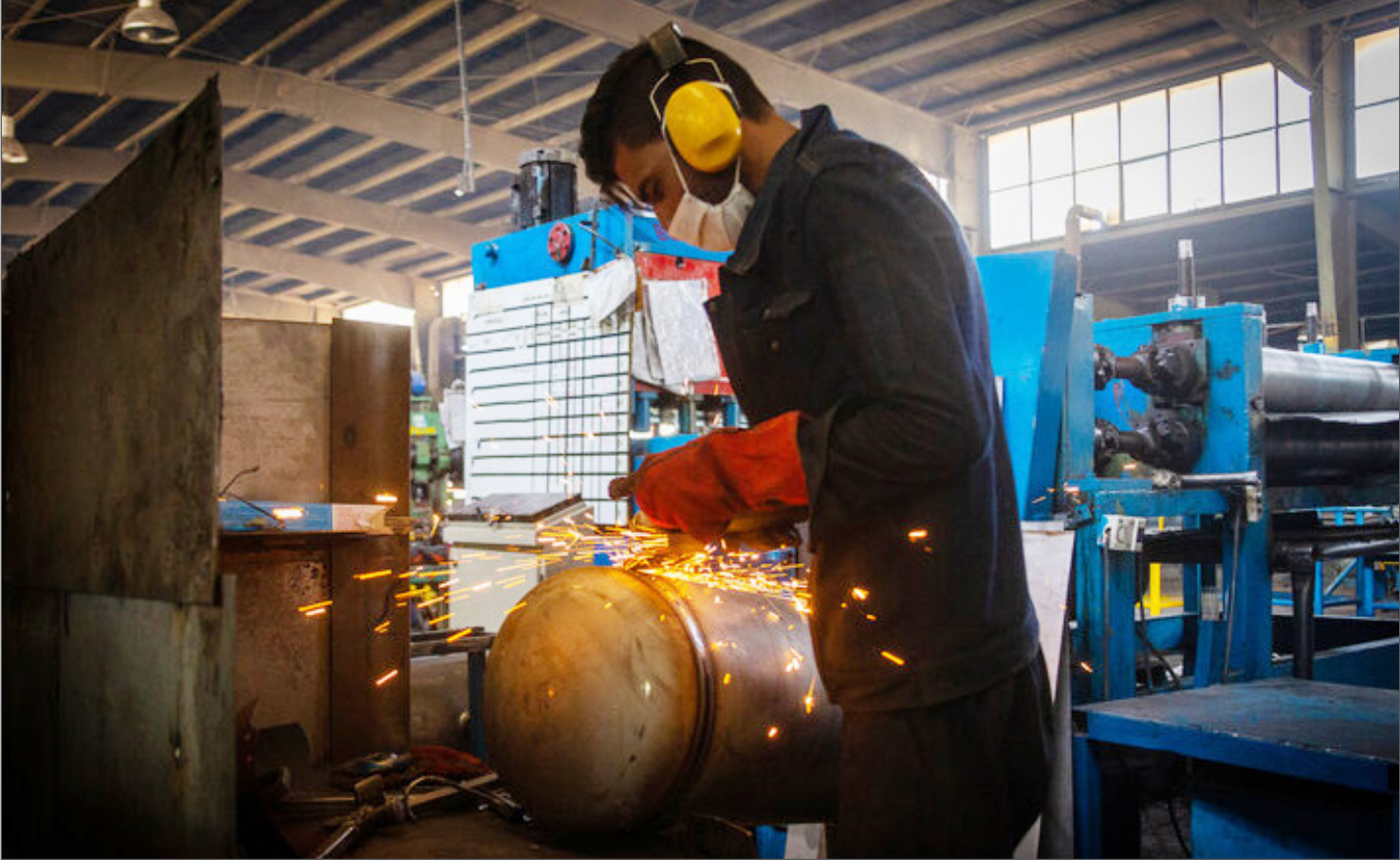
روایت یک کارشناس از میزان کسری بودجه دولت