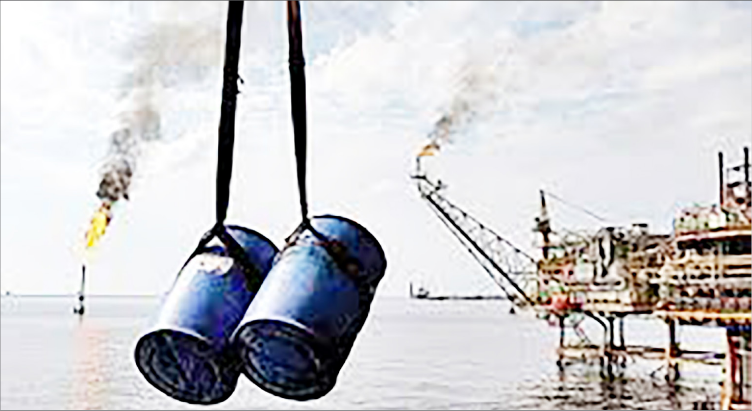
قطر با استفاده از میدان پارس جنوبی تولید گاز خود را ۴۰ درصد افزایش خواهد داد

وی با بیان مطلب فوق افزود: ۳۰۴ مورد بازرسی از پروژه ها، ۹۱ مورد بازرسی از ایستگاه های تغذیه فشار، ۹۷ مورد بازرسی از ایستگاه های حفاظت کاتدیک، ۲۰ هزار و ۴۵۳ مورد نظارت و تأییدیه تست هیدرواستاتیک، ۲۶۳ هزار و ۵۰۳ مورد نظارت و تأییدیه تست نیوماتیک، ۱۰۷ هزار و ۵۹۲ مورد نظارت و تأییدیه تست پوشش و ۵۵ تست و صدور مجوز جوشکاران فولادی و پلی اتیلن از جمله اقدامات مهم و اساسی واحد بازرسی فنی در راستای اقدامات پیشگیرانه و جلوگیری از وقوع حوادث می باشد.