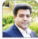
حسین سلاح‌زوری نایب رئیس اتاق بازرگانی ایران

به موجب بند (ه) ماده ۱۶ قانون اتاق بازرگانی، صنایع و معادن و کشاورزی ایران، تهیه، پیشنهاد و اصلاحات بعدی آیین‌نامه‌های اجرایی این قانون از جمله وظایف هیئت نمایندگان اتاق ایران است که باید توسط این رکن تهیه و به شورای عالی نظارت پیشنهاد شود. بنابراین اساساً موضوع برداشتن محدودیت ریاست دو دوره‌ای توسط هیئت رئیسه اتاق ایران کاملاً کذب و در ادامه سناریوی تخریب این نهاد قانونی است.