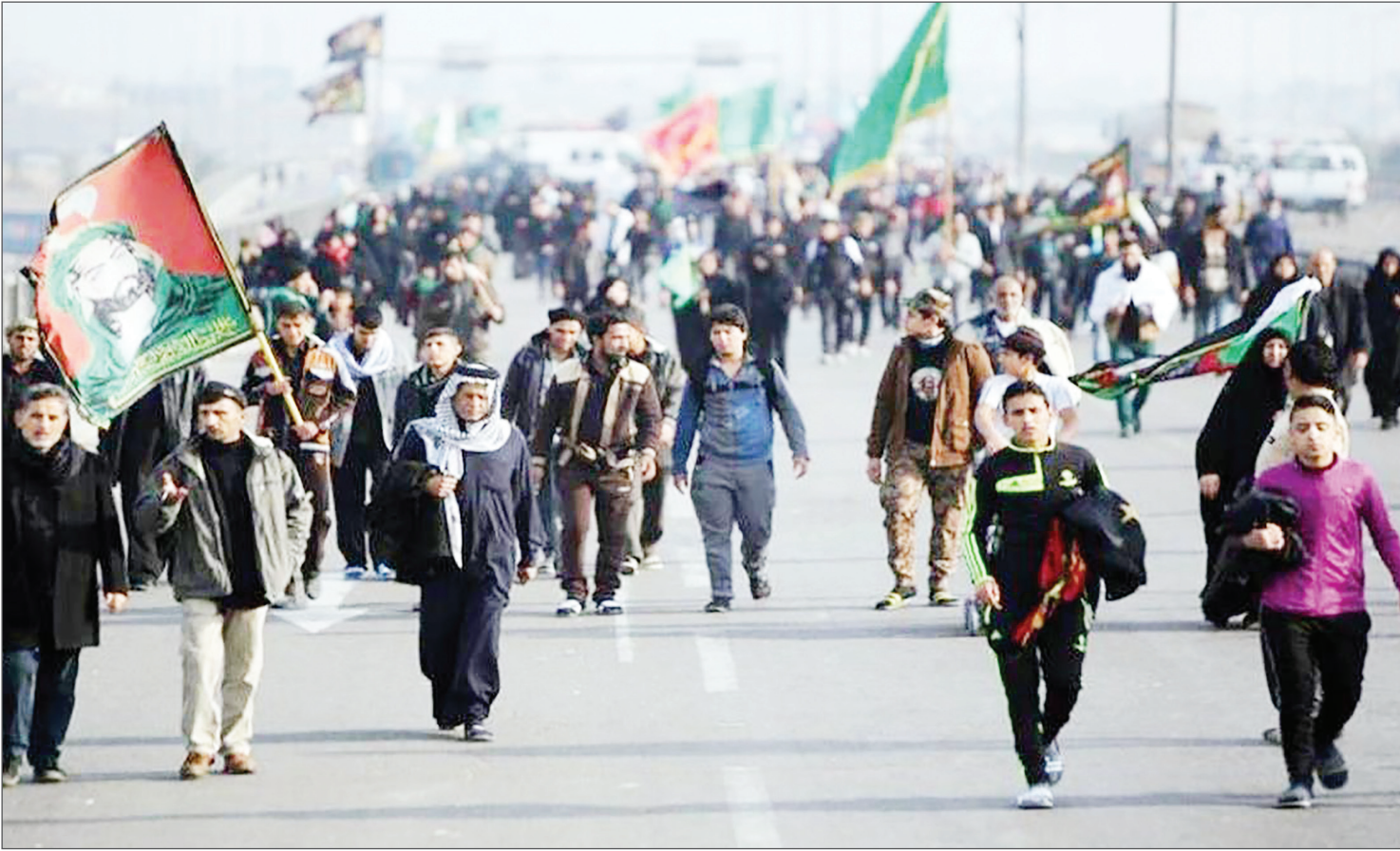
زوار اربعین: قربانی قیمت‌گذاری دستوری شدند

اقتصاد آنلاین: صادق الحسینی اقتصاددان، در پاسخ به این سؤال که یارانه نقدی بهتر است یا کالا برکت گفت: زمانی که ارز ۴۲۰۰ تومانی توسط دولت حذف شد، قول داد که بعد از چندماه کالا برگ خواهد داد. ما هشتاداد هشتاد و دویم که این کار غلط است. زیرا نه ممکن است و نه بهینه. اما چرا؟ زیرا این کار به فرآیند اجرایی قوی نیاز دارد که از توان دولت خارج است و همچنین بهینه نیست چون باعث می‌شود فساد گسترده‌ای برای این انجاس از سوی متولیان شکل بگیرد. در واقع کسب کاری برای آن‌ها ایجاد می‌شود که از چه کسی و به چه قیمتی بخرند و چه قدر پورسانت دریافت کنند. وی ادامه داد: فساد می‌شود هم در تخصیص به وجود می‌آید. یعنی چگونه به خانوارها تخصیص پیدا کند، کدام خانواده بیشتر دریافت کند و کدام کمتر؟ از طرف دیگر معاملات اقتصادی نشان داده است که اگر یارانه به صورت نقدی پرداخت شود، بیشترین میزان رفاه خانواده در این حالت محقق می‌شود. لذا حرکت دولت به آن سمت یک دام است و دولت را در یک گرداب اجرایی خیلی سنگین می‌اندازد و هم به ضرر خانوارهاست. اگر این این اتفاق بیفتد یعنی مافیای فساد پشت این قضیه بوده است.