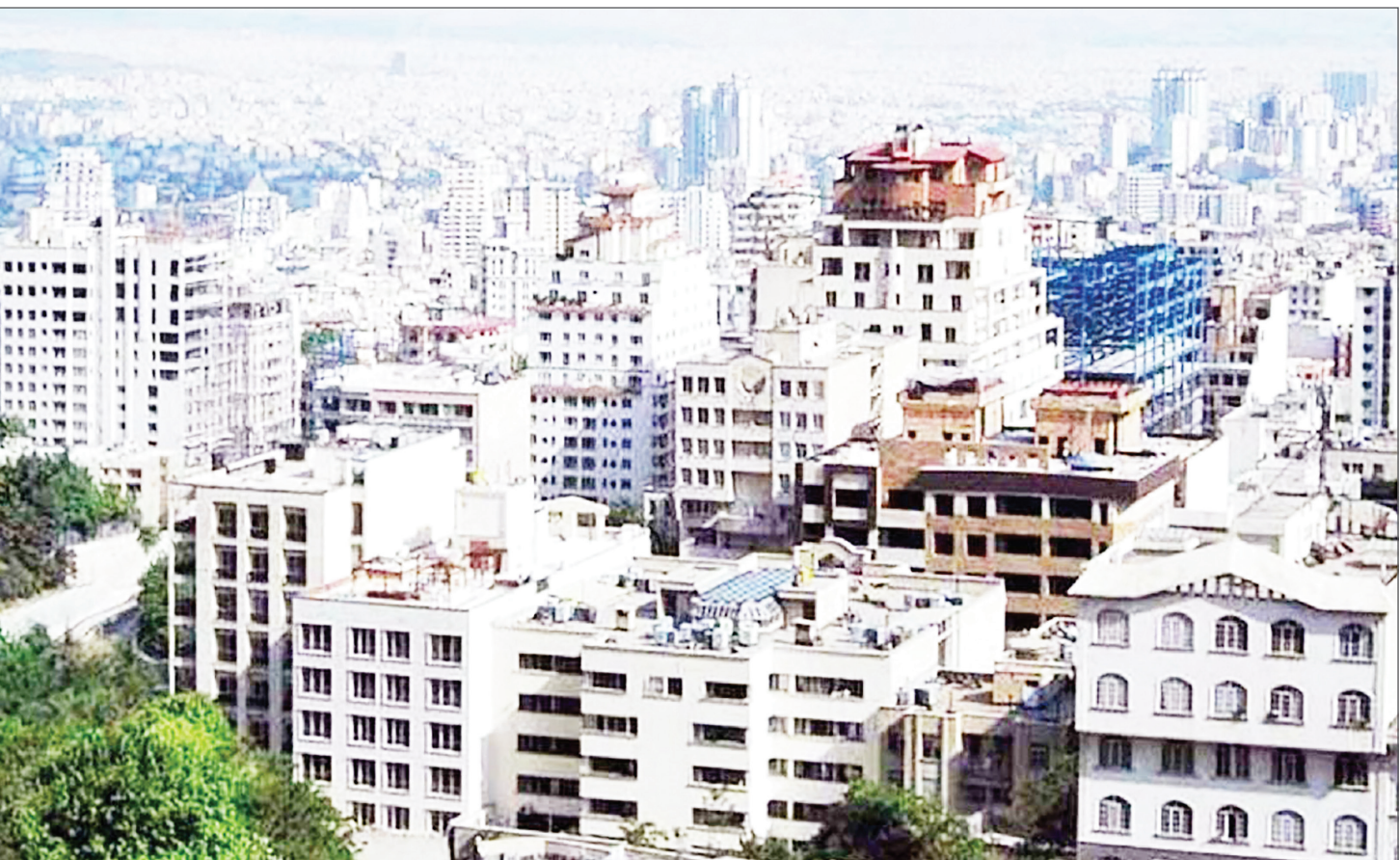
عضو هیئت مدیره انجمن انبوه‌سازان در گفت‌وگو با «تدبیر تازه» مطرح کرد

طبق بررسی‌های میدانی در شهریورماه، حجم مراجعه برای خرید مسکن در شهر تهران به شدت کاهش یافته و رشد نرخ‌های پیشنهادی تقریباً متوقف شده است. مشاوران املاک شهر تهران از ادامه ٪ رکود بازار مسکن در شهریورماه خبر می‌دهند. روند افت معاملات از اوایل تیرماه آغاز شده، در مردادماه پیدا کرد و همچنان وجود دارد. بنا به گفته واسطه‌های ملکی، رکود شهریور از مردادماه هم سنگین‌تر است. این در حالی است که طی سال‌های گذشته معمولاً در شهریور به عنوان آخرین فرصت جابه‌جایی معاملات رونق داشت. روند رشد قیمت خانه نیز متأثر از رکود معاملات کاهش چشمگیری داشته است. برخی منابع از صفر شدن رشد ماهیانه قیمت ملک در پایتخت خبر می‌دهند. واسطه‌های ملکی عنوان می‌کنند که فروشنده‌های پول لازم، نرخ‌های پیشنهادی را کاهش داده‌اند و ممکن است با ادامه کساد معاملات، بازار بیشتر افت کند. با وجود آن که بخش خرید و فروش با رکود مواجه شده، بازار اجاره مقداری رشد دارد. البته تقاضا برای اجاره کاهش پیدا کرده اما نرخ‌های پیشنهادی رهن و اجاره مسکن در شهر تهران همچنان رو به بالا است. کارشناسان ملکی مهم‌ترین عوامل رکود بازار مسکن را تأثیرپذیری از عوامل غیراقتصادی و قرار داشتن در ماهی محرم و صفر می‌دانند. انتظار می‌رود با پایان ماه صفر، معاملات اندکی افزایش پیدا کند اما اثر ریسک‌های غیراقتصادی تا زمان مشخص شدن وضعیت ادامه خواهد داشت.