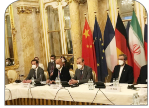
ایران: پیشرفت خوبی در مذاکرات محقق کردیم

آخرین اخبار ایران و جهان را در پایگاه تحلیلی - خبری تدبیر تازه نیوز بخوانید