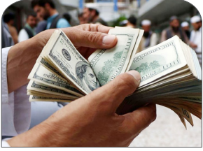
حذف کامل ارز تزجیبی به جز دارو و کتدم