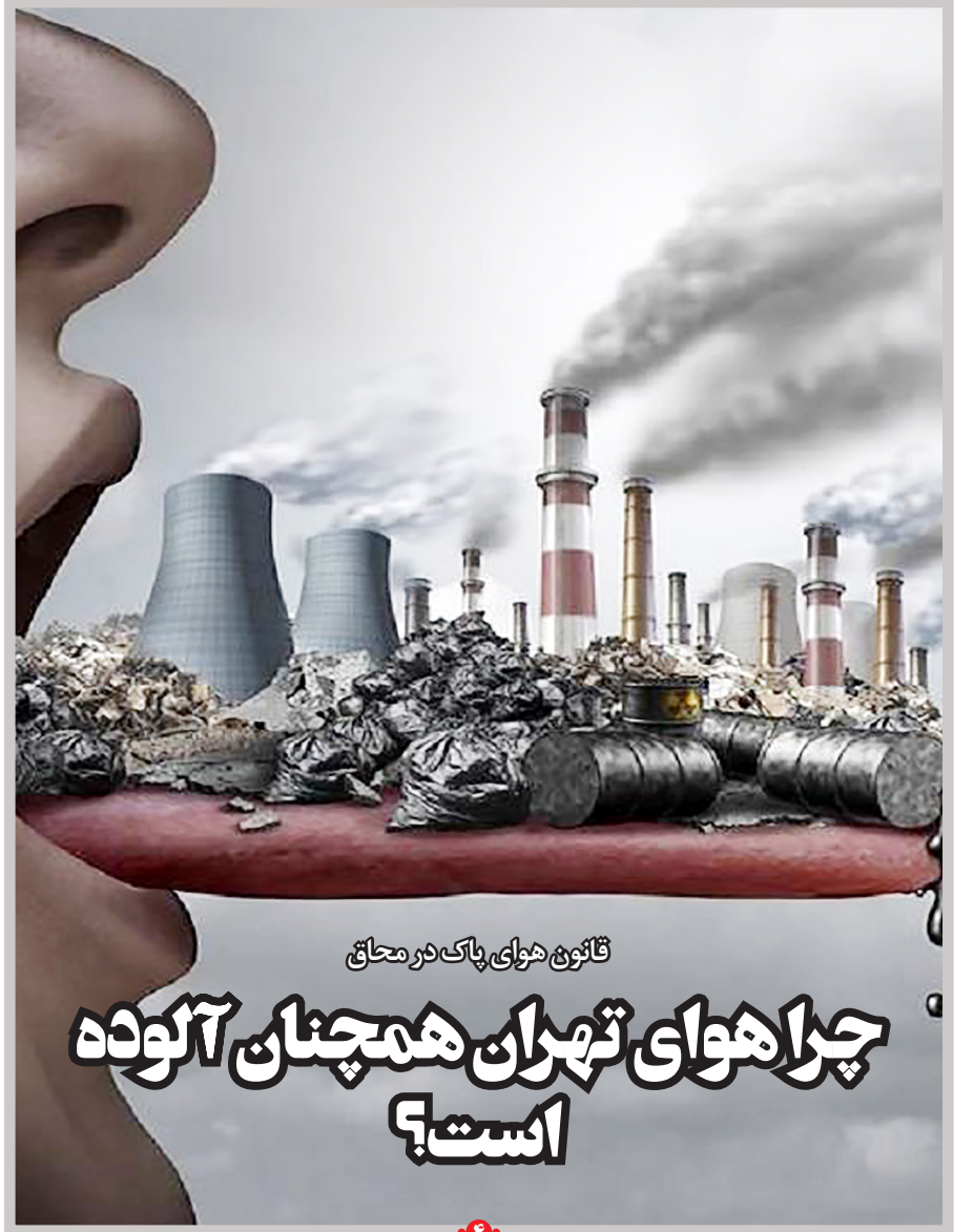
قانون هوای پاک در محاق